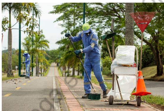
Ilustración 2. Actividad de Barrido y Limpieza

Es importante indicar que para la prestación del servicio de barrido en la ciudad de Villavicencio, no aplica los respectivos acuerdos de barrido y limpieza con la Administración Municipal.