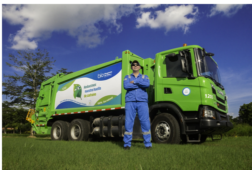
Ilustración 1. Vehículo recolector de residuos ordinarios.

Bioagrícola del Llano cuenta con una flota de 25 vehículos recolectores tipo compactador de entre 17 y 28 Yd 3 , los cuales son utilizados para la recolección de residuos ordinarios. Para la recolección de los grandes generadores, se hace uso de contenedores de 3 y 5 yardas cúbicas, para lo cual, el 13% de los vehículos cuenta con el sistema de recolección de contenedores de 3 yardas y para la recolección de contenedores de 5 yardas cúbicas, se tiene un vehículo tipo Ampliroll. Los doce vehículos restantes cuentan con sistema de izaje Lifter para contenedores plásticos de hasta 1100 Litros.